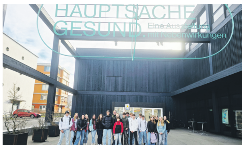
Aufnahme vom Besuch unserer Konfirmandinnen und Konfirmanden im Stapher- haus, Lenzburg in «Hauptsache Gesund. Eine Ausstellung mit Nebenwirkungen»