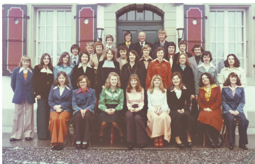
Foto: Konfirmation in der Kirche Grafenried, 1975

Am Palmsonntag, 13. April, findet in beiden Kirchen ein festlicher Gottesdienst zur Feier der Goldenen Konfirmation (1975–2025) statt. Im Anschluss an den Gottesdienst haben die goldenen Konfirmandinnen und Konfirmanden aus Grafenried und Limpach die Gelegenheit, bei einem gemeinsamen Mittagessen im Gasthof Kreuz in Grafenried sich auszutauschen und alte Erinnerungen aufzufrischen.