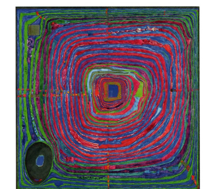
«Der grosse Weg» von Hundertwasser

Es werden Rückblick und Vorschau Platz haben, eine Standortbestimmung und die Bitte um Gottes Segen für den weiteren Lebensweg.