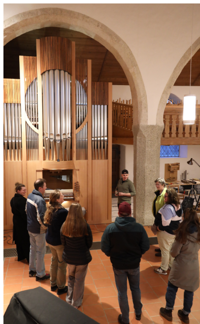
Bilder: Sally Jo Rüedi