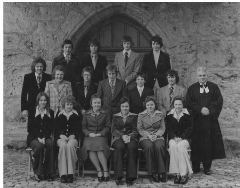
Konfirmation Jhg 1959