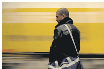
Film «Gefangene des Schicksals»