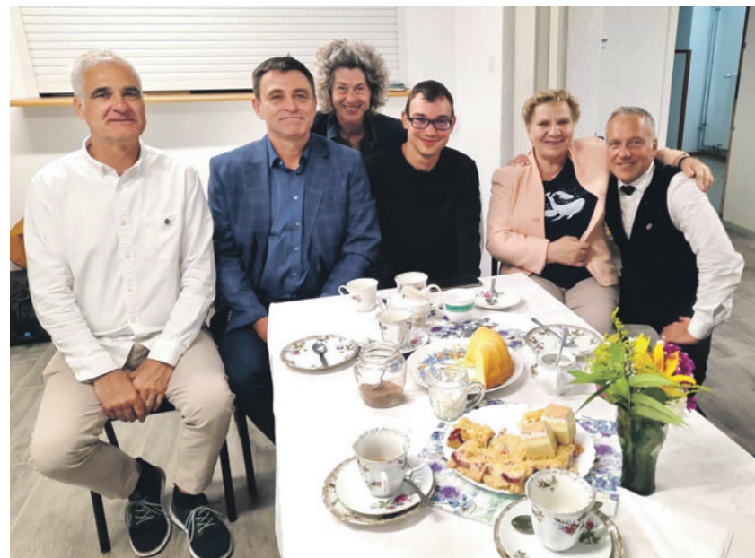
Kirchenkaffee nach dem Gottesdienst in Ostroda

PS: Ein Bildband zur Information liegt auf in der Kirche Grafenried im Eingang!