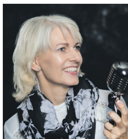
www.wally-schneider.ch