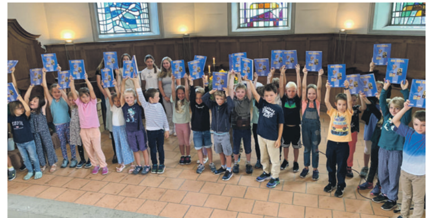
KUW-Startfest vom 18. August