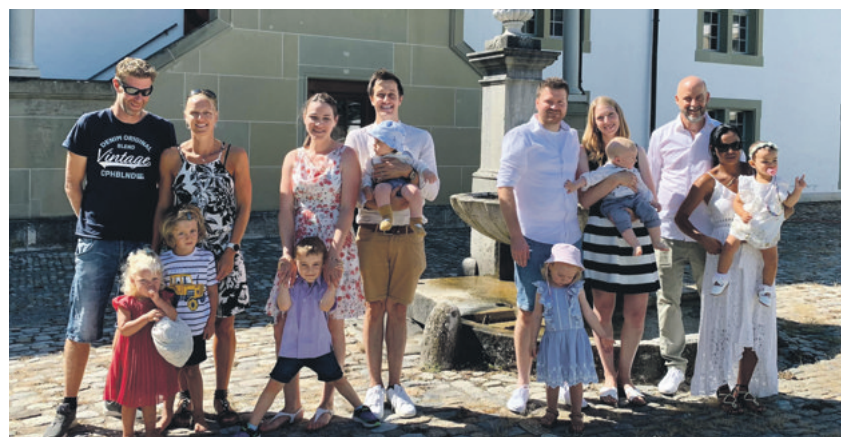
Impressionen vom Schloss-Gottesdienst vom 11. August