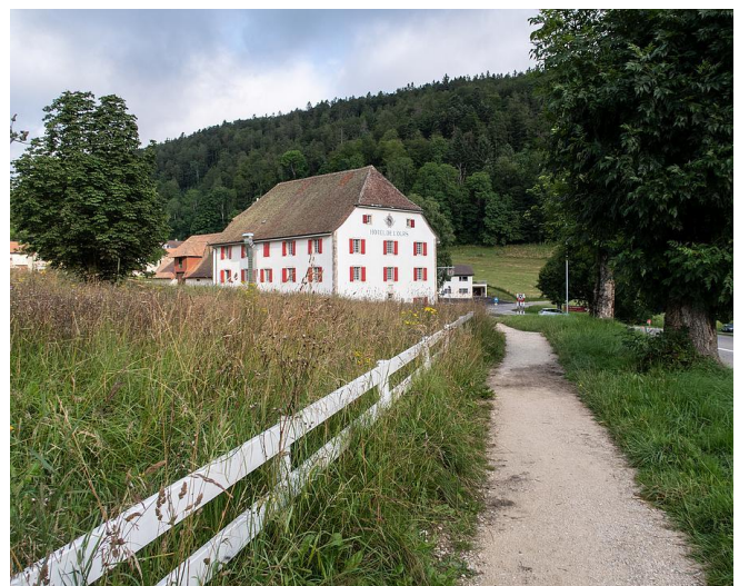
Hotel «Bären» Bellelay