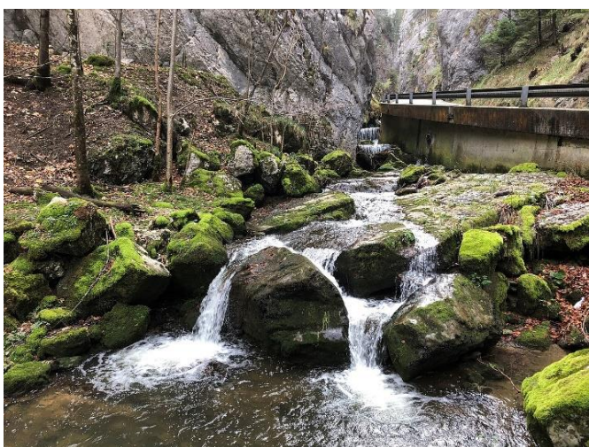
Gorges du Pichoux