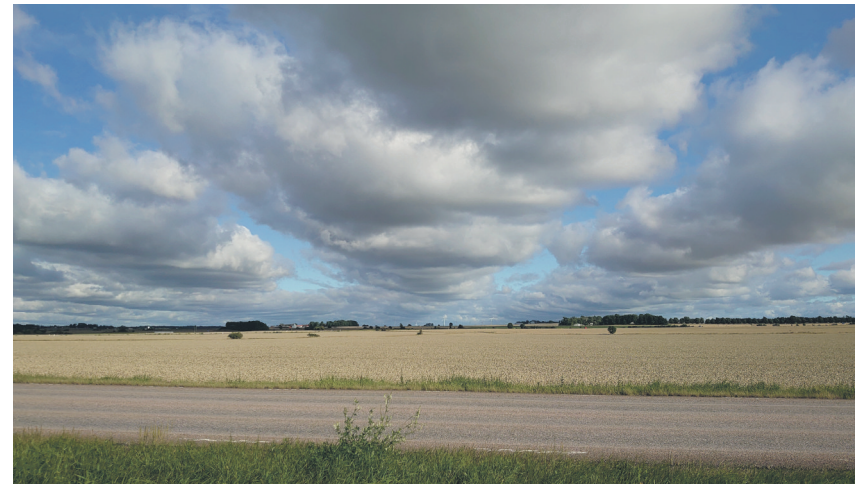
Sommerfelder unter Wolkenhimmel

Der Wechsel der Jahreszeiten möchte uns mitnehmen, es ihnen gleich zu tun und unser Leben mit ihm zu gestalten. Niemand kann immer aktiv sein, blühen und Frucht bringen, keiner kann auf Dauer nur zurückgezogen im Drinnen leben. «Alles hat seine Zeit» hat der weise Prediger diesen Gedanken zusammengefasst und durchbuchstabiert. Im 3. Kapitel seines alttestamentlichen Buches stellt er einige Gegensatz-Paare einander gegenüber: «Geborenwerden und Sterben, Pflanzen und Ausreißen, Töten und Heilen, Niederreißen und Aufbauen, Wei-